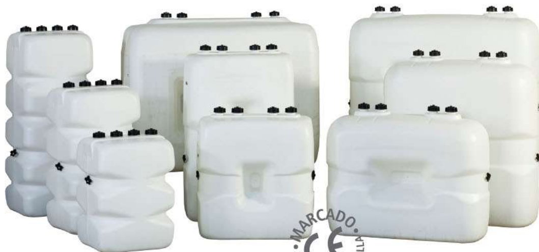
Gama de tanques de pared sencilla Gama de tanques de parede simple