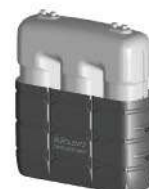
Cubeto de retención Reforço de retenção