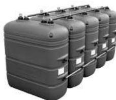
Elemento complementario União de um taque adicional a uma bateria