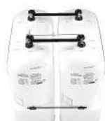
Elemento básico União de dois tanques em baterias